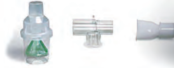
330158 Tコネクタ マウスピース付