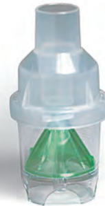
330500 本体 (6cc)