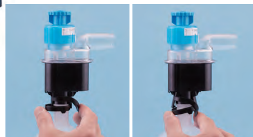
【ボトルの取り外し方】