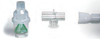
330158 Tコネクタ マウスピース付