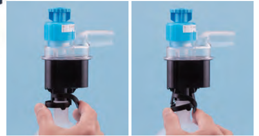
【ボトルの取り外し方】