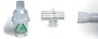
330158 Tコネクタ マウスピース付