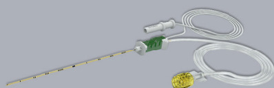
販売名：パユンク 神経ブロック針 医療機器承認番号：22200BZX00905000 クラス III